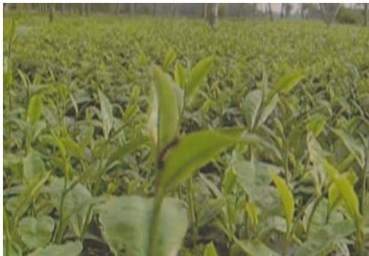
Plate 3. Looper infested tea field