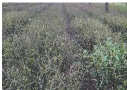
Plate 6. Denuded tea field by Looper