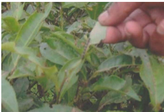
Plate 5. Looper infested tea plants