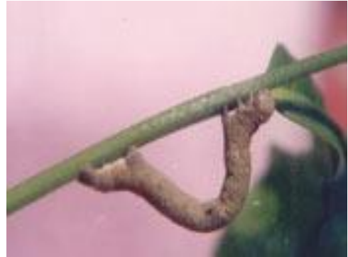
Plate 4. Looper Caterpillar