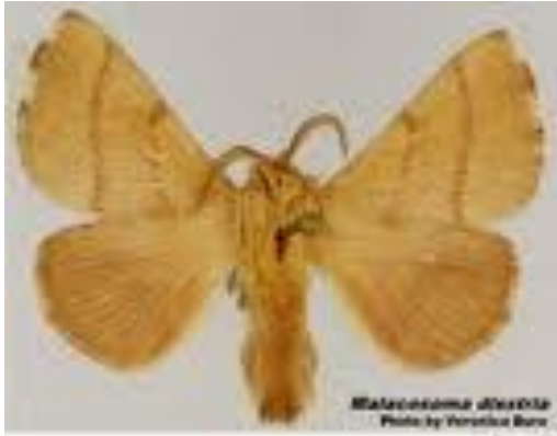
Plate 1. Adult Moth of Looper